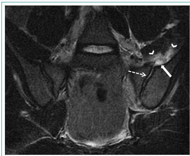
Figura 2. Resonancia magn3tica de articulaciones sacroilíacas. Corte coronal T2 FSE. Se identifica una articulaci3n sacroilíaca izquierda ensanchada con aumento de la se3al compatible con derrame articular (flecha punteada), que asocia un absceso en su vertiente craneal (flecha s3lida) con edema/cambios flemonosos en m3sculo ilíaco izquierdo (cabezas de flecha). El absceso coincide con la localizaci3n de la burbuja de gas en la TC.

drogas intravenosas, la endocarditis y el traumatismo 2,3 . Analic3ticamente suele haber aumento de reactantes de fase aguda.