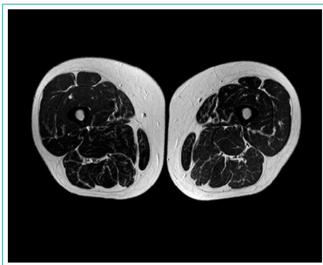
Figura 1. RM muscular (obsérvese la ausencia de datos inflamatorios)